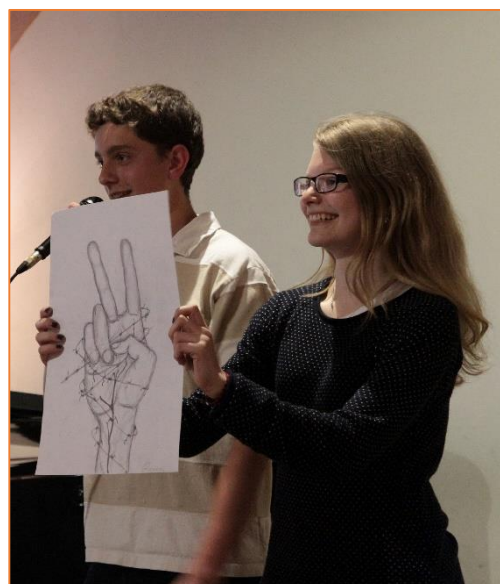
Obě fotky jsou z roku 2015 – materiální sbírka a aukce v aule